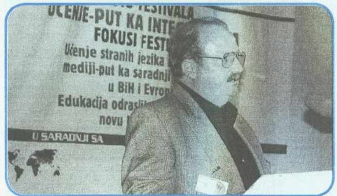
Die Begründer des Lernfestes in Bosnien-Herzegowina

Obwohl man noch immer über die Profilierung des lebenslangen Lernens diskutiert, es ist, insbesondere in Europa, als ein Grundbedürfnis akzeptiert. Hauptgründe für seine Einführung sind: