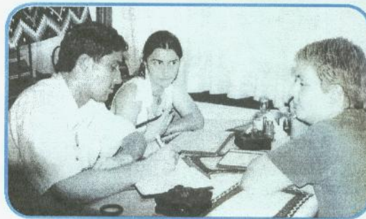
Werkstätte in Skopje (Mazedonien) Planung gemeinsamer Tätigkeiten im Rahmen der Erwachsenenbildung in Südosteuropa

Nach den Angaben, über die die Organisationen der Roma verfügen, gibt es im Kanton Tuzla 35 Siedlungen der Roma. Darin leben rund 16.000 Roma. Laut Statistiken haben 16.000 Bewohner ca. 4.000 Kinder im Grund- und Hauptschulschulalter. Anstatt 4.000 Roma-Schüler in 12 Grund- und Hauptschulen, in deren Gebiet sich diese Roma-Siedlungen befinden, sitzen in den Schulbänken 313 Roma-Kinder. Von diesen 313 besuchen 290 die Grundschule, also I. bis IV. Klasse, und 23 besuchen die höheren Hauptschulklassen. Daraus geht hervor, dass nur etwa zehn Roma ihre Grund- und Hauptschulbildung vervollständigen werden.