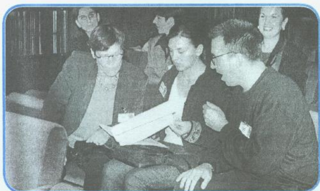
Idejni tvorcii festivala učenja u Bosni i Hercegovini

Cjeloživotno učenje nameće se kao imperativ današnjeg i, nadalasve, nadolazećeg vremena. Ne radi se samo o potrebi inoviranja stručnih znanja i vještina kako bi se mogle pratiti i opsluživati nove tehnologije i proizvodna sredstva, komunikacijski sistemi i sl., već i o akceptiranju duhovno kulturnih, etičkih i drugih vrijednosti, tekovina civilnog društva, demokratije, osvajanju i zaštiti temeljnih ljudskih prava i sloboda itd.