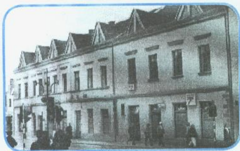
Novi aktivni suorganizatori