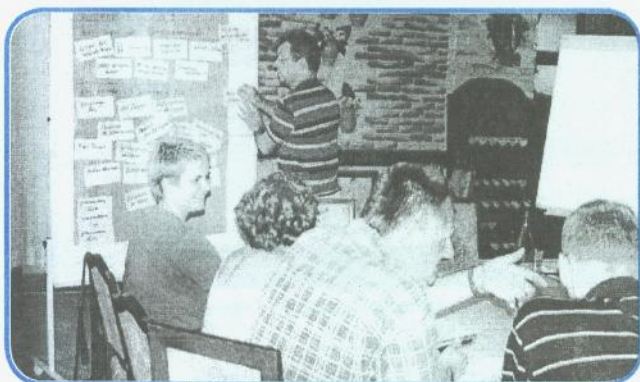
Radionica u Skoplju (Makedonija) Planiranje zajedničkih aktivnosti u obrazovanju odraslih na nivou jugoistočne Evrope

Prema podacima romskih organizacija, u Tuzlanskom kantonu ima 35 romskih naselja. U njima živi oko 16.000 Roma. Statistički parametri govore da na 16.000 stanovnika dolazi oko 4.000 djece osnovnoškolskog uzrasta. Umjesto 4.000 učenika Roma u 12 osnovnih škola na čijim se područjima nalaze ova romska naselja u školskim klupama je 313 učenika Roma. Od ovih 313 učenika 290 su učenici od I do IV razreda, a 23 su učenici starijih razreda. To ukazuje da će tek desetak Roma upotpuniti svoje osnovno obrazovanje.