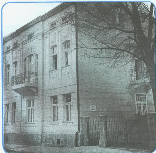
Impuls i ideja Festivala učenja iz kuće "Amica" prerasli su u Festival učenja u Bosni i Hercegovini

Kod traumatiziranih osoba, kao i drugih osoba, često nastupa nemogućnost verbalnog izražavanja, što zahtijeva traženje novih pristupa a izražavanju koje je u početku moguće i bez riječi: slikanje, tjelesni rad, meditacije... "Educa" omogućava stručnim osobama da sami na sebi osjete proces učenja, što unapređuje kompetenciju i profesionalnost u pristupu djeci i odraslima. Na osnovu ličnih iskustava, klijentu se otvaraju novi putevi i omogućuju ostvarivanje novih, drugačijih, kontakata - tzv. iscjeliteljski elementi u zajednici.